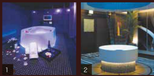
1.七色に光る浴槽「HOTARU」で幻想的な時間を 2.ドアを開けた途端思わす声がある

☎086-276-2227 岡山市中区平井1163-3 客室：32室 P：33台 http://www.okayama-crea.com