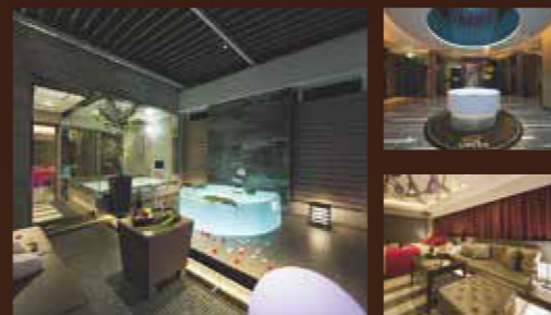
七色に光る浴槽の露天風呂。 ミルクィな泡が心地よい、開放感たっぷりのバスルーム